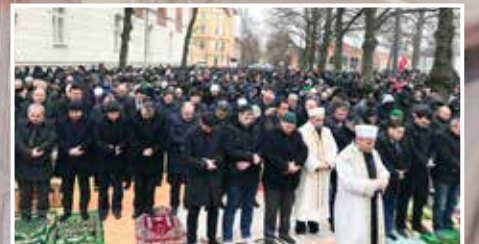
HABERLER | NACHRICHTEN: Berlin'de Cuma Namazı'na Yoğun Katılım Unzählige Besucher bei Freitagsgebet in Berlin ▶ S. 16