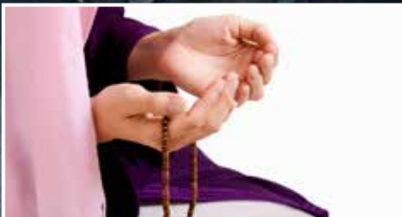
MINBER'DEN SESLENİŞ | STIMME VON DER PREDIGTKANZEL: Kadın: Hayat Ortağımız Die Frau: TeilhaberIn unseres Lebens ▶ S. 14