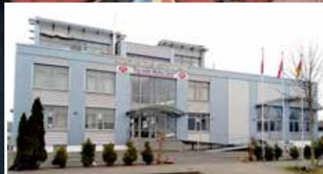
CAMİLERİMİZ | UNSERE MOSCHEEN: Köln-Chorweiler DİTİB Merkez Camii Köln-Chorweiler DİTİB Zentralmoschee ▶ S. 12