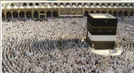
MINBER'DEN SESLENİŞ | STIMME VON DER PREDIGTKANZEL: Kutsal Yolculuk: Hac İbadeti Gesegnete Reise: die Pilgerfahrt ▶ S. 14