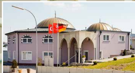
CAMİLERİMİZ | UNSERE MOSCHEEN: Ransbach-Baumbach DİTİB Yeni Camii Ransbach-Baumbach DİTİB Neue Moschee ▶ S. 12