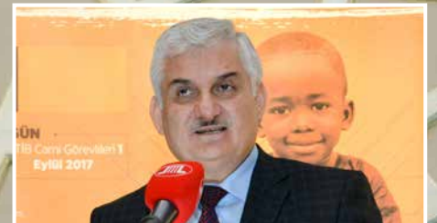
HABERLER | NACHRICHTEN: Kurban Bayramı Mesajı Botschaft zum Opferfest ▶ S. 16