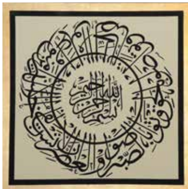
Asr Suresi | Koran, al-Asr 103/1-3

Sowohl für die Festtage als auch für alle übrigen Veranstaltungen verfügt die Neue Moschee über ausreichend Räumlichkeiten und entsprechende Parkmöglichkeiten. Außerdem werden im ganzen Monat Ramadan gemeinsame Fastenbrechen (Iftar) organisiert und die Moschee ist Hausherrin für Veranstaltungen wie Verlobungen und Beschneidungsfeiern oder für andere Veranstaltungen religiöser und sozialer Art.