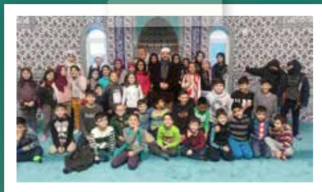
Neustadt an der Weinstraße