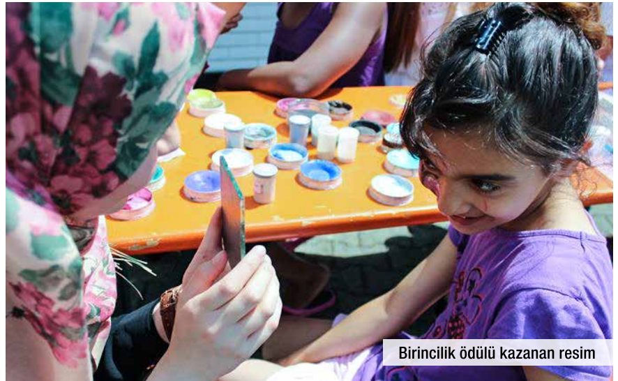
Birincilik ödülü kazanan resim