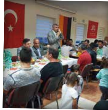
Lohr am Main