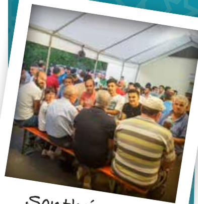
Sontheim a. d. Brenz