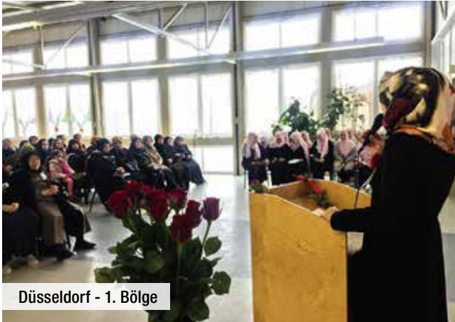
Düsseldorf - 1. Bölge

ya, getirdiği tevhid dininin ve rah-met yüklü evrensel mesajlarını daha iyi anlatmaya vesile olmuş-tur.