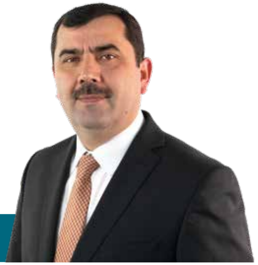
Kazım TÜRKMEN DİTİB Genel Başkanı • DİTİB-Vorstandsvorsitzender