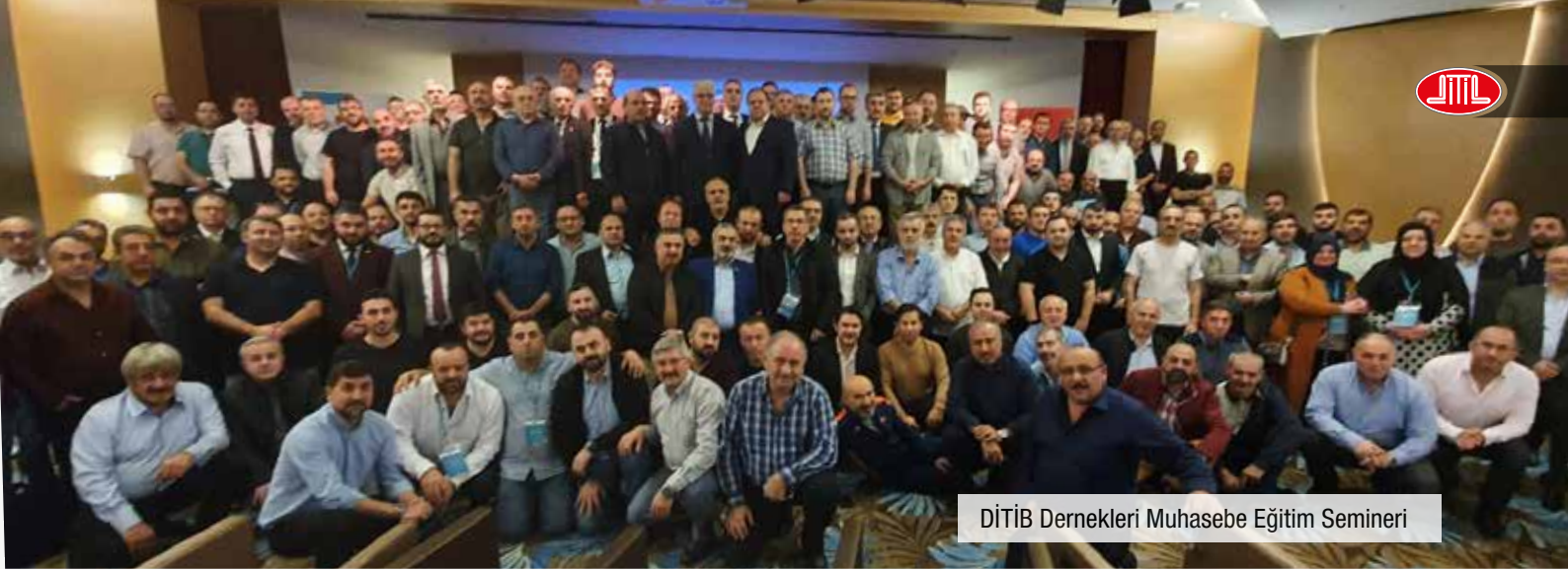
DİTİB Dernekleri Muhasebe Eğitim Semineri