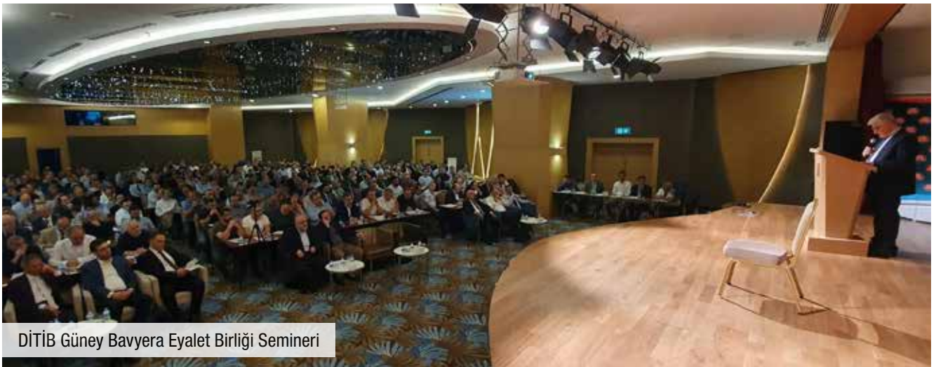
DİTİB Güney Bavyera Eyalet Birliği Semineri

kurulu başkanları, eyalet birliği başkanları, dernek başkanları, muhasebeden sorumlu yönetim kurulu üyeleri ile DİTİB birim müdürleri katıldı.