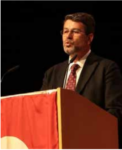
Kurulu Başkanlığı ve Kuzey Bavyera DİTİB Eyalet Birliği Başkanlığı

Mevlid-i Nebi programında katılımcılara günün anısına gül takdim edildi.