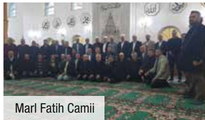
Marl Fatih Camii