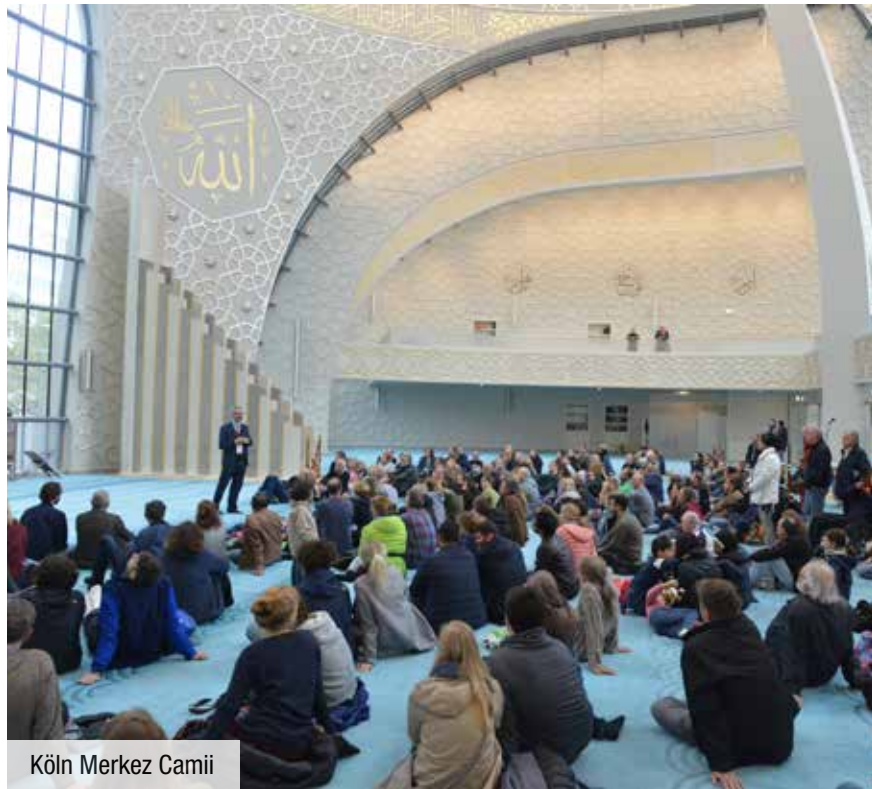
Köln Merkez Camii