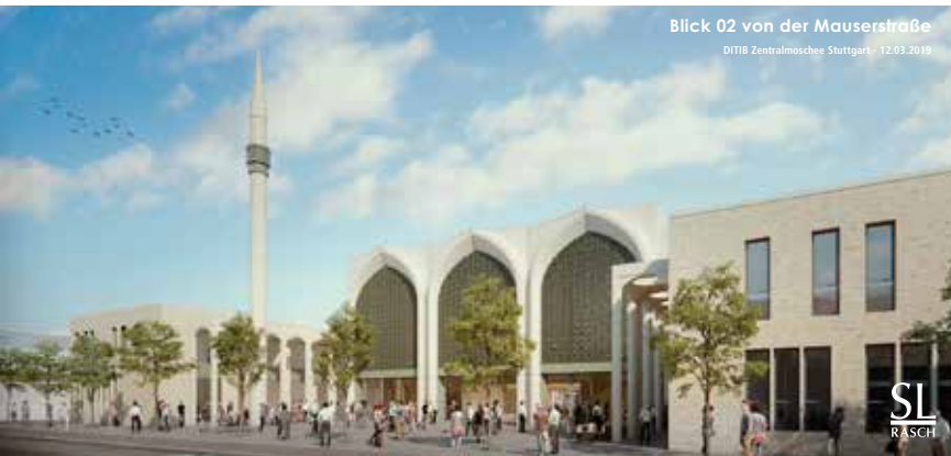
Blick 02 von der Mäuserstraße DİTİB Zentralmoschee Stuttgart, 12.03.2019