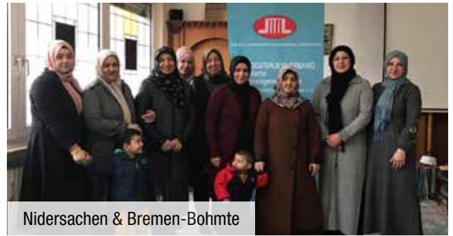
Niedersachen & Bremen-Bohnte