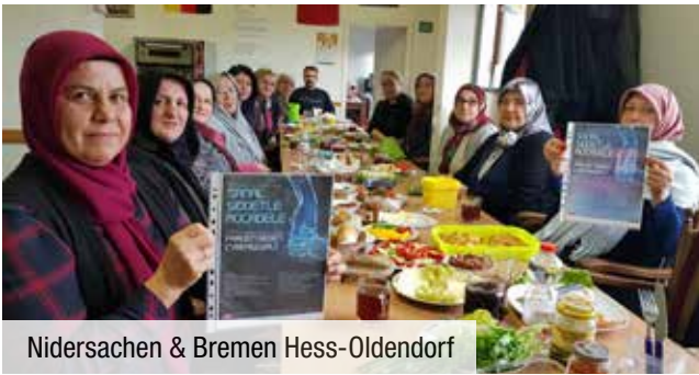
Niedersachen & Bremen Hess-Oldendorf