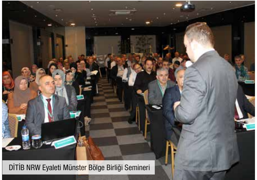
DİTİB NRW Eyaleti Mönster Bölge Birliği Semineri

Üç gün süren hizmet içi eğitim seminerinde; derneklerin yazışma ve dosyalama kuralları, derneklerimizin karşılaştığı hukuki sorunlar ve