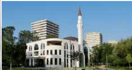
CAMİLERİMİZ | UNSERE MOSCHEEN: Lahr DİTİB Ulu Camii Lahr DİTİB Ulu Moschee ▶ S. 6