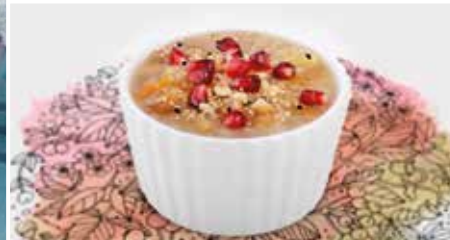
MİNBER'DEN SESLENİŞ | STIMME VON DER PREDIGTKANZEL: Muharrem Ayı ve Aşure Günü Der Monat Muharram und der Aschura-Tag ▶ S. 8