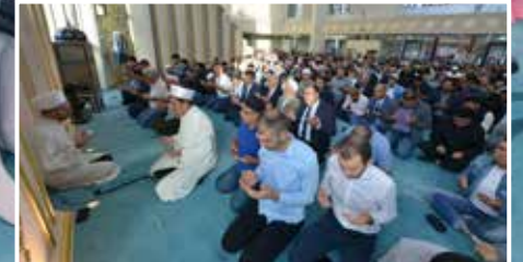
HABERLER | NACHRICHTEN: Kurban Bayramımız Mübarek Olsun Ein gesegnetes Opferfest ▶ S. 20