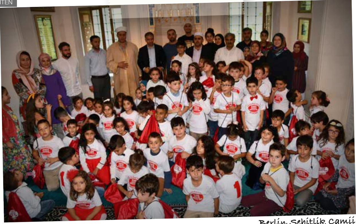
Berlin Şehitlik Camii