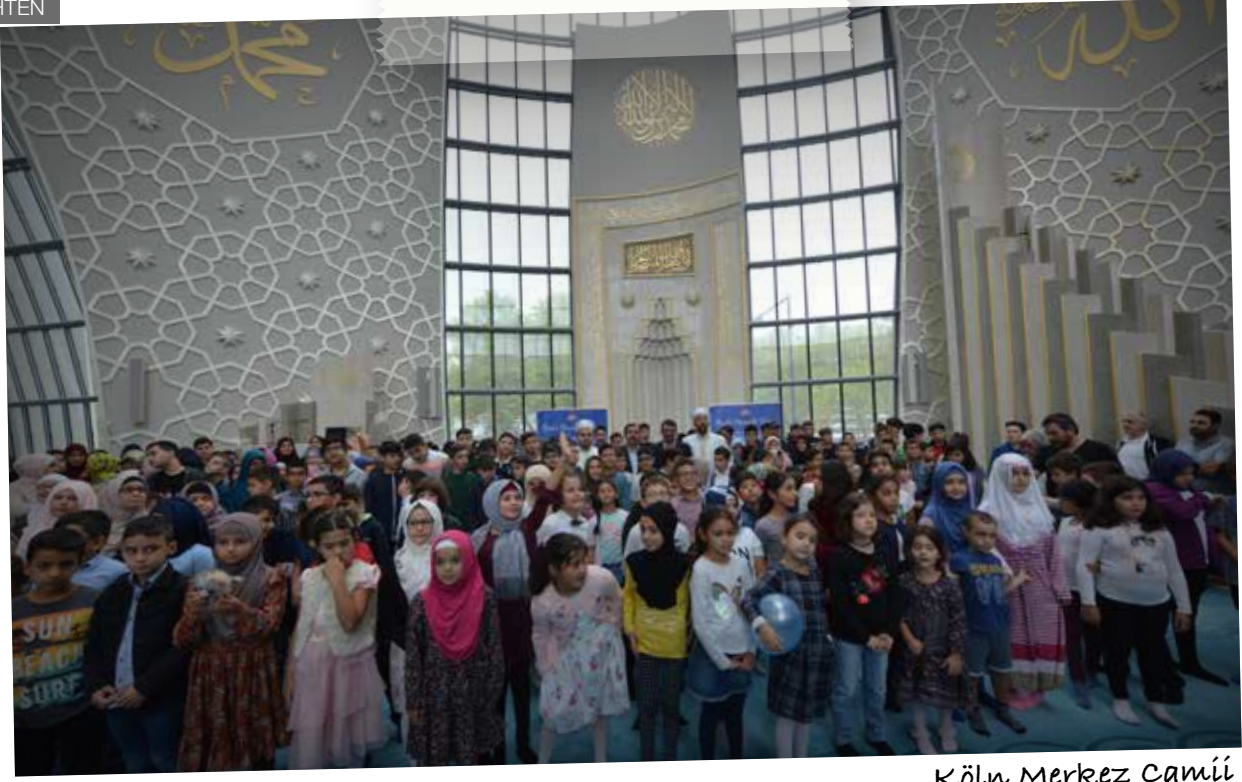
Köln Merkez Camii