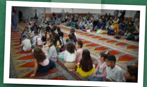
Krefeld Yunus Emre