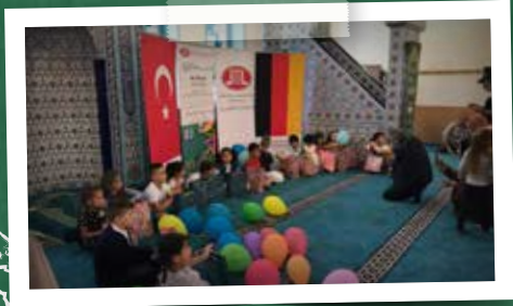
Duisburg Yunus Emre