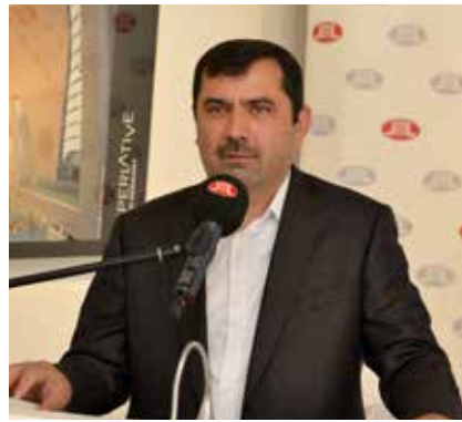
2019 Hac Organizasyonu hakkında bilgi veren Hac Koordinatörü

Hac organizasyonunda görev alacak kabile başkanlarımıza ve grup görevlilerimize kolaylıklar ve başarılı bir hac dönemi diliyorum. Rabbim hacınızı mebrur, dualarınızı kabul eylesin" şeklinde konuştu.