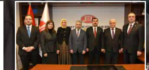
HABERLER | NACHRICHTEN: DİTİB Yeni Yönetim Kurulu'nu Seçti DİTİB wählt neuen Vorstand ▶ S. 10