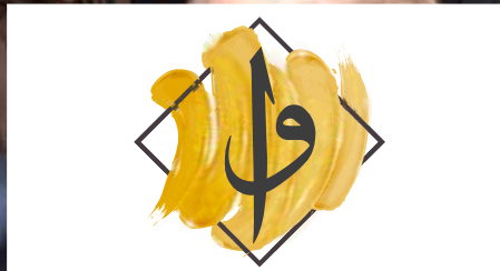
MİNBER'DEN SESLENİŞ | STIMME VON DER PREDIGTKANZEL: Allah'a inandım de, sonra dosdoğru ol! Sage: Ich glaube an Allah und sei dann aufrichtig! ▶ S. 8