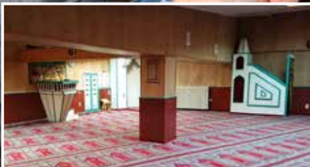
CAMİLERİMİZ | UNSERE MOSCHEEN: Berlin DİTİB Merkez Camii Berlin DİTİB Zentralmoschee ▶ S. 6